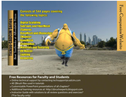
Pixologic ZBrush 4R7 A Comprehensive Guide, 3 rd Edition

Also available as eBook http://ebooks.cad/cim.com