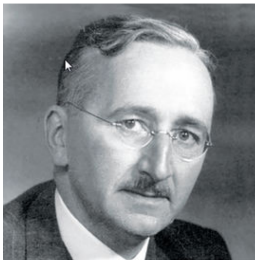
F.A. Hayek O Caminho da Servidão

A tese central de Hayek é que todas as formas de coletivismo, seja o nazismo ou o socialismo, levam inevitavelmente à tirania e à supressão das liberdades, conforme já se evidenciava à época pelos exemplos da Alemanha Nazista, da União Soviética, e dos demais países do bloco comunista. O autor argumenta que, em um sistema de planejamento central da economia, a alocação de recursos é de responsabilidade de um pequeno grupo, sendo este incapaz de processar a enorme quantidade de informações pertinentes à adequada distribuição destes bens à sua disposição. Face à gigantesca concentração de poder nas mãos de um limitado número de burocratas, divergências acerca da implementação das políticas econômicas levaria inexoravelmente ao uso da força pelo governo para que suas medidas fossem toleradas.