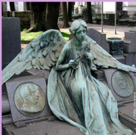
Escriba de Cristo

Ao escrever comentÁrios sobre o livro de Enoque procuro entender o que há de verdade nas histórias contadas nele. Em primeiro lugar eu sou um convicto defensor da ideia dos nefilins, da hipótese que na Terra houve gigantes na antiguidade. Creio que seres celestiais (anjos) abandonaram seus postos nos céus para viverem carnalmente entre nós. Deste acasalamento de duas espécies nasceram gigantes, uma espécie híbrida. A humanidade foi corrompida geneticamente, o que fez Deus decidir pelo dilúvio que matou aquela geração de híbridos e quase aniquilou com a humanidade. Mas não creio que todo o livro tenha Enoque como autor. Suponho que houve adulterações ao longo da história e que uma porção considerável foi acrescentada séculos antes de Cristo. De qualquer maneira sua leitura é interessantíssima aos que buscam entender a origem de tudo.