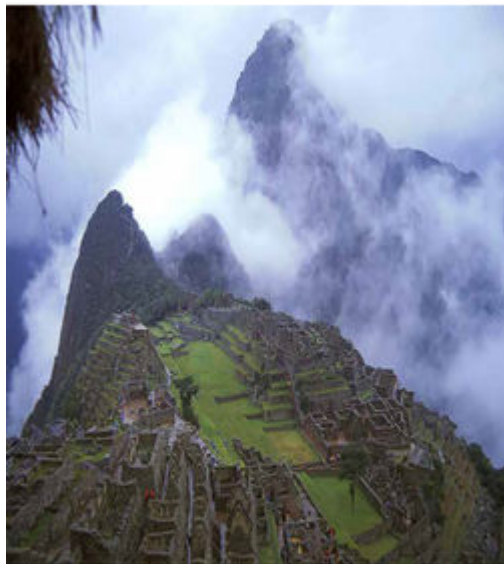
GUÍA DE MACHU PICCHU