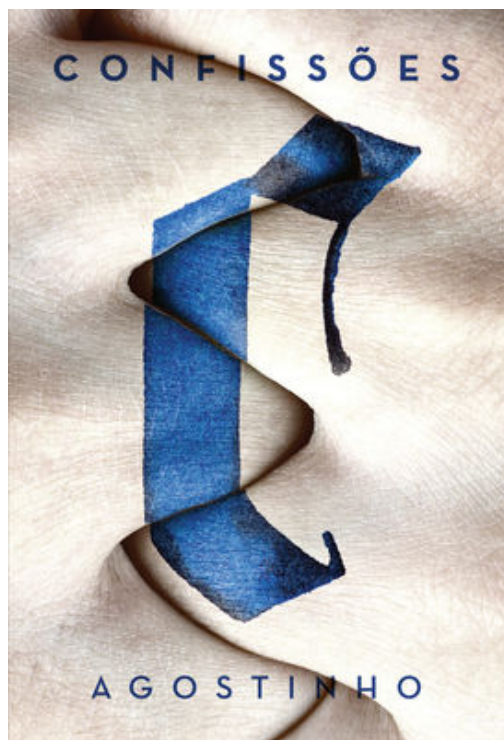
Figura central na história da Igreja, o bispo Agostinho de Hipona (354-430) influenciou decisivamente o pensamento católico e protestante. Confissões apresenta-se como a primeira obra que explora amplamente os estados interiores da mente humana e o relacionamento mútuo entre graça e livre-arbítrio.

Esta autobiografia espiritual extraordinariamente honesta e reveladora aborda questões fundamentais da doutrina cristã. Ao investigar as diversas vicissitudes do ser humano, seus erros e sofrimentos, Agostinho descobre a vigorosa presença de Deus e sua providência.