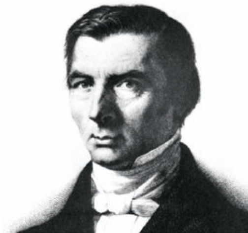
Frédéric Bastiat A Lei

Escrito no ano da morte do autor, A lei é um bom diagnóstico da situação da França pós-revolucionária com relação as ideias de lei e justiça promovida por certos filósofos. Para ele, a Lei deve proteger o indivíduo, a liberdade e a propriedade privada. Infelizmente, essa mesma lei pode ser pervertida e posta a serviço de interesses particulares, tornando-se, então, um instrumento de espoliação. É dessa maneira que Bastiat analisa o funcionamento do Estado, esta "grande ficção através da qual todos se esforçam para viver às custas dos demais". Para o autor, protecionismo, intervencionismo e socialismo são as três forças de perversão da lei. Apesar de escrito há mais de 160 anos, a temática permanece atual.